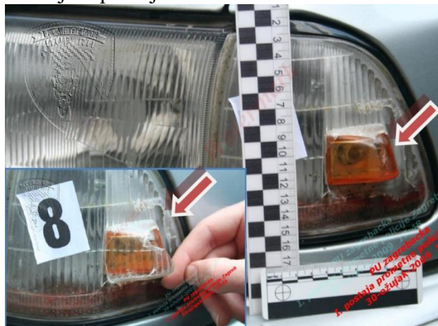
Slika 4. Izuzimanje tragova s vozila čiji vozač je napustio mjesto događaja[5]

Na slici 4. prikazan je primjer slučaja iz prakse kojim je identificirano vozilo kojim se vozač udaljio s mjesta događaja, a temeljem dobro obavljenog očevida i brzom reakcijom policijskih službenika.